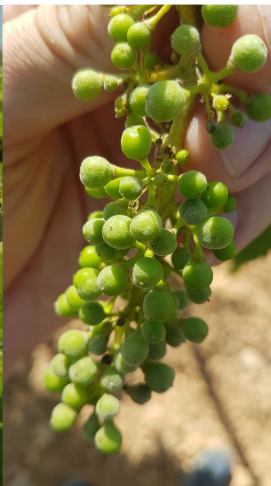
LA CONCA DE BARBERÀ